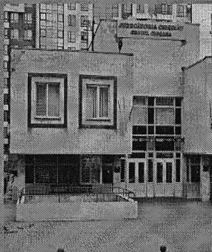
Judecătoria Chișinău sediul Ciocana

Specializat în materie de fine de activitatea judecătorească de instrucțiune. Adresa: MD-2075, mun. Chișinău, str. Mihail Sadoveanu, 24/1 Tel: (+373 22) 34-26-20, 44-10-90 E-mail: jci@justice.md