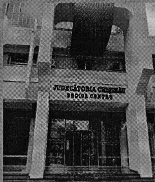
Judecătoria Chișinău sediul Centru

Specializat în materie civilă. Adresa: MD-2004, mun. Chișinău, bd. Ștefan cel Mare și Sfint, 162 Tel: (+373 22) 27-55-44, 27-45-08 E-mail: jcc@justice.md