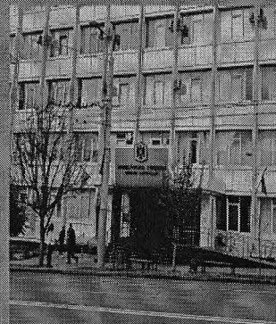
Judecătoria Chișinău sediul Bulucani

Specializat în materie penală și materie contravențională. Adresa: MD-2004, mun. Chișinău, bd. Ștefan cel Mare și Sfint, 209 Tel: (+373 22) 29-50-96, 29-47-55 E-mail: jbu@justice.md