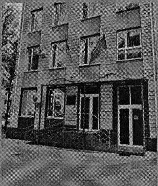
Judecătoria Chișinău sediul Rîșcani

Specializat în materie de contencios administrativ și materie contravențională. Adresa: MD-2069, mun. Chișinău, str. Kiev 3 Tel: (+373 22) 45-08-41, 43-80-87 E-mail: jrc@justice.md